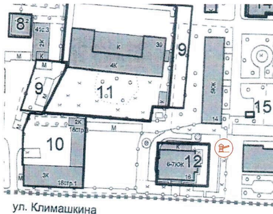
Схема установки ограждения (1-го шлагбаума) на территории муниципального округа Пресненский по адресу: Климашкина ул., д. 16