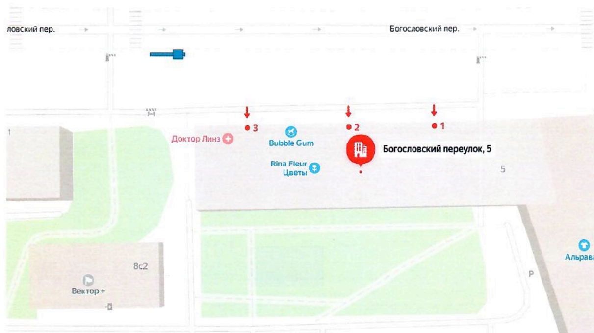
Схема установки ограждающего устройства (1-го шлагбаума) на придомовой территории муниципального округа Пресненский по адресу: Богословский пер., д. 5

к решению Совета депутатов муниципального округа Пресненский от 13.12.2023 № 19.12.221