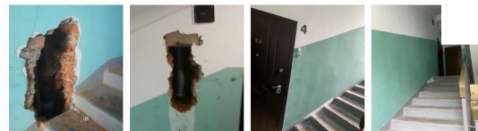
ул. Гашека, 11