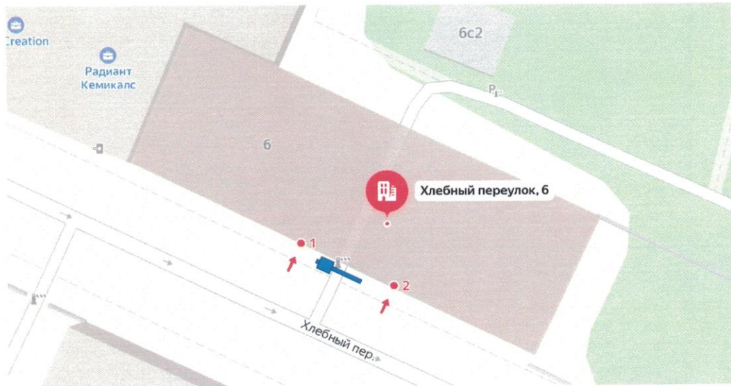
Схема установки ограждающего устройства (1-го шлагбаума) на придомовой территории муниципального округа Пресненский по адресу: Хлебный пер., д. 6

к решению Совета депутатов муниципального округа Пресненский от 17.01.2024 № 21.06.232