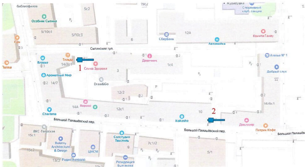
Схема установки ограждающих устройств (2-х шлагбаумов) на придомовых территориях муниципального округа Пресненский по адресам: Богословский пер., д. 16/6, с. 1; Палашёвский Б. пер., д. 10; Палашёвский Б. пер., д. 14/7, с. 1; Палашёвский Б. пер., д. 14А; Сытинский туп., д. 1, с. 4; Сытинский туп., д. 3

к решению Совета депутатов муниципального округа Пресненский от 13.12.2023 № 19.13.222