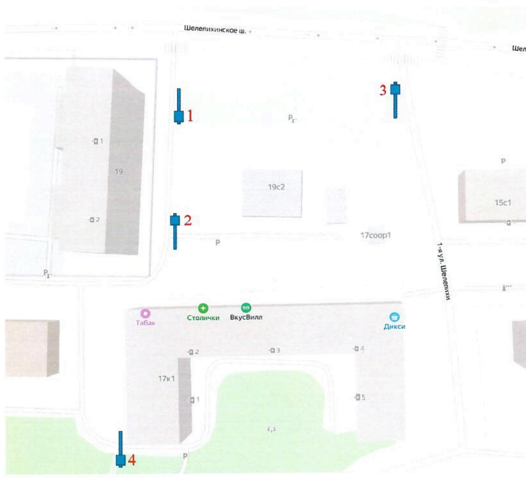
Схема установки ограждающих устройств (4-х шлагбаумов) на придомовой территории муниципального округа Пресненский по адресу: Шелепихинское ш., д. 17, к. 1